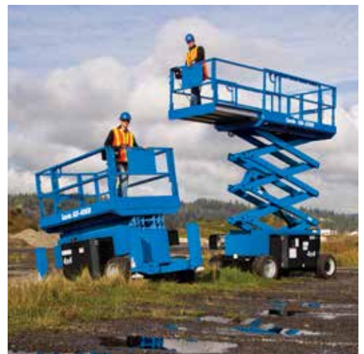
Los modelos de la serie GS-69 RT tienen una extensión de cesta entre 91 cm y 1,52 m.

En todo el mundo, la GS™-4069 es la primera plataforma de tijera todoterreno de su clase que puede desplazarse a su máxima altura de 12,12 m. Los modelos GS-2669 y GS-3369 también están equipados con esta función, prolongando así el tiempo productivo.